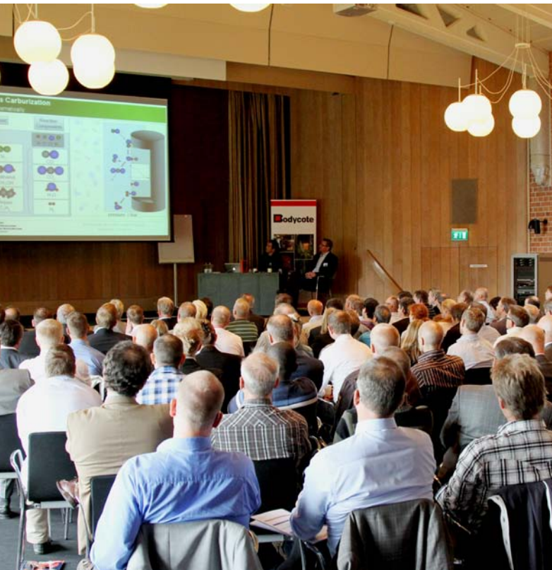
Seminarier gav deltagarna värdefull information och goda möjligheter att skapa bättre nätverk för framtida problemlösningar och samarbete.