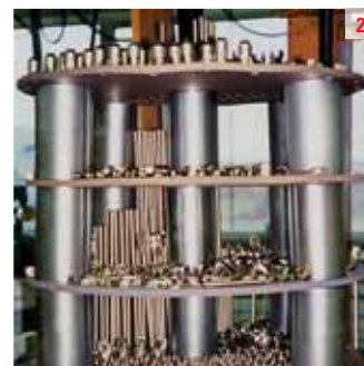
1. Pignon en alliage de Titane traité par Tinitron® 2. Une charge, exemple de pièces nitrurées.