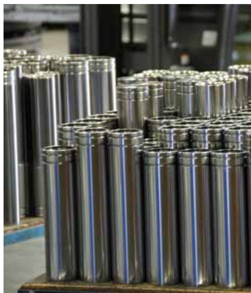
CYLINDER Detaljbild från PMC.